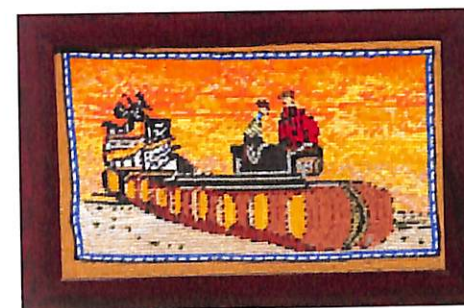
Trabajadores sobre barriles

Hombres trabajando con barriles de vino en Villa Franca del Panadés, lugar más cercano a Vilanova i la Geltrú, donde podían aprovisionarse en diferentes fábricas, los buques que iban de Barcelona a Manzanillo.