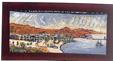
Sector del Puerto de Barcelona

Sacado de un grabado del primer tercio del siglo XIX, con el Mont Juith al fondo. Desde este puerto se embarcó Duarte a Puerto Rico en 1831.