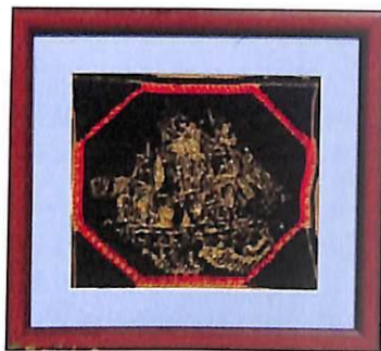
Sello de Manzanillo

Copia del sello comercial que se imprimía en los documentos para los pedidos de mercancías que se traían de Barcelona a Manzanillo.