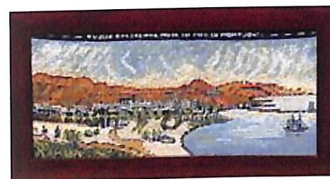
Puerto de Vilanova i la Geltrú