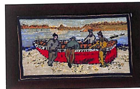
Bote con pescadores

Escena cotidiana del puerto de Vilanova i la Geltrú, ambientada en el primer tercio del siglo XIX.