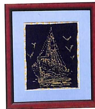
Embarcación en alta mar

Típica del primer tercio del siglo XIX, tomada del Museo de Vilanova i la Geltrú.