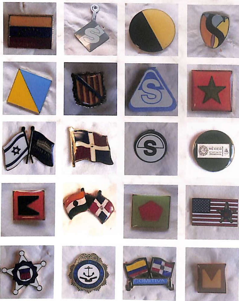
Servicio Secreto de los Estados Unidos. Parlamento de Israel (Knesset). México. India. Venezuela. España. Cumbre Presidencial del Sica-Brasil. Islas Baleares. Colombia. La India.