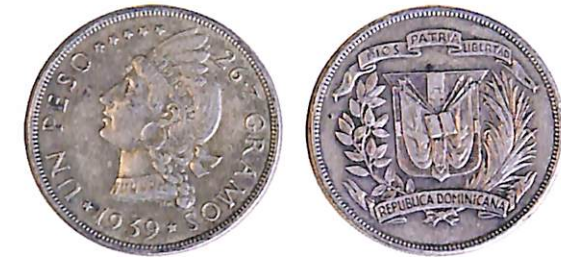
Moneda de 1.00 peso año 1939.

En el año 1937 se inicia una Reforma Monetaria para tratar de reorganizar todo el sistema monetario del país. Para tales fines, se promulgó la Ley de Moneda Metálica Nacional No. 129, donde se establecía, además de las denominaciones, la composición, el peso, la forma, las dimensiones y la tolerancia en la composición, que sería igual a la de las monedas de iguales denominaciones de los Estados Unidos. Mediante esta Ley, el país adoptaba su propio patrón monetario.