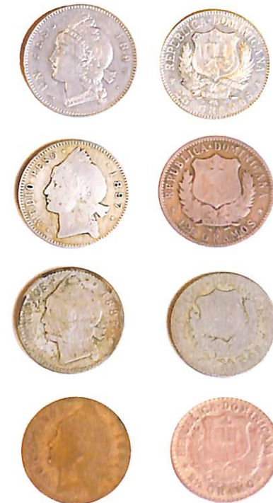
Monedas de 1897. 0.10 centavos. 0.20 centavos. 0.50 centavos. 1.00 peso.

En la parte superior, una larga cinta azul baja hasta los flancos diestro y siniestro, llegando casi a las ramas de laurel que se encuentran a cada lado, cuyos tallos se cruzan en el centro, atados por una cinta roja. En el extremo inferior, escrita en una cinta roja, la divisa DIOS PATRIA LIBERTAD. Fue utilizado en el diseño de los billetes de 1898.