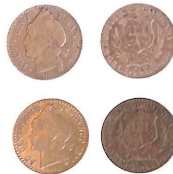
Franco dominicano 1891.

hasta mediados del siglo veinte, y fueron posteriormente depreciadas a un cuarto de centavo y medio centavo, respectivamente. El valor de dichas monedas se encuentra expresado tanto en números como en letras, en un diseño encuadrado por un cerco en el contorno exterior, formado por un ramo de laurel, a la izquierda y uno de palma a la derecha, enlazados al centro, sobre cuya unión aparece una estrella.