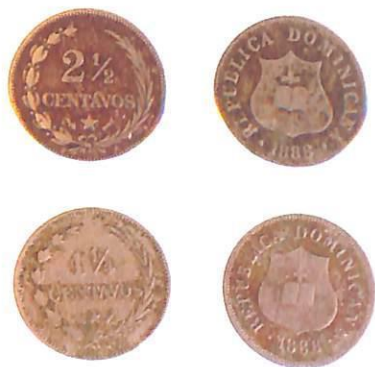
Monedas de 2 1/2 centavos, año 1888.