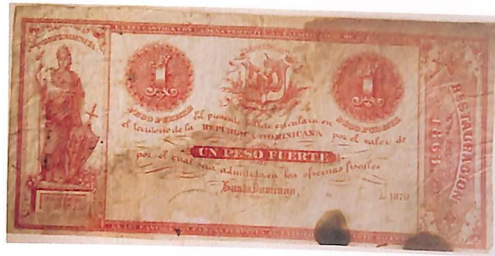
Billete de 1.00 Peso Fuerte sin emitir, año 1870.

Los billetes del gobierno restaurador son, en cierto modo, obsidionales o de necesidad. Están impresos de un solo lado y firmados y numerados a mano.