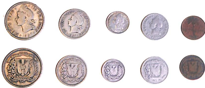
Monedas de 1937.

A la diestra del escudo un ramo de laurel y, a la siniestra, uno de palma, con sus tallos cruzados en el centro, atados por un ancho lazo rojo y más abajo una cinta roja con el lema REPUBLICA DOMINICANA. Sobre el jefe del escudo, en una cinta azul, la divisa DIOS PATRIA LIBERTAD.