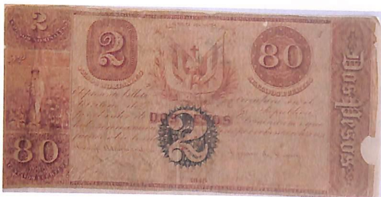
Billete de 1.00 peso de 1848. (anverso y reverso)