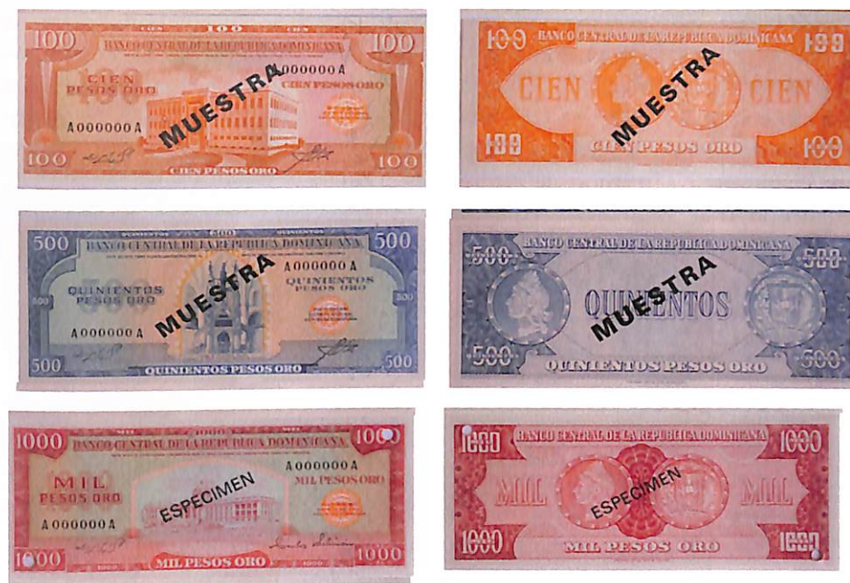
Billetes de la Tercera Emisión, serie 1964-1976.