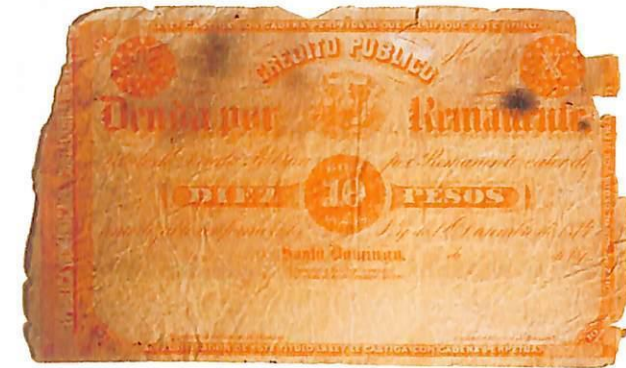
Título de Deuda Pública por remanente, 1874.