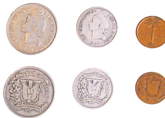
Monedas de 1947.