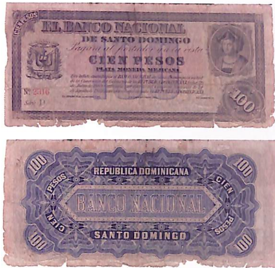
Banco Nacional de Santo Domingo. Billete de 2.00 pesos año 1889. Billete de 25.00 pesos año 1889. Billete de 100.00 pesos año 1889.

El Banco Nacional de Santo Domingo fue establecido por la Sociedad de Crédito en el 1889, y sus billetes estaban garantizados en monedas de plata mexicanas.