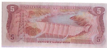
Billetes de la Cuarta Emisión, serie 1977-1998. 5.00 pesos.

En el centro del billete aparece, en tonos muy tenues, el Escudo Nacional, hasta el 1994. A partir de 1995, sus cuartetos están estructurados en los colores