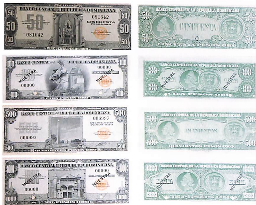
Billetes de la Primera Emisión, serie 1947-1961