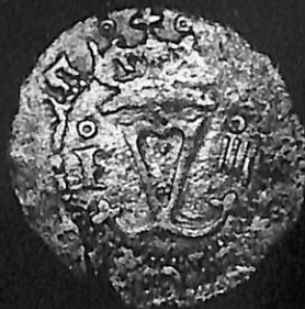
Cuatro maravedises de cobre