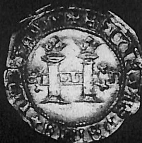
Dos reales de plata