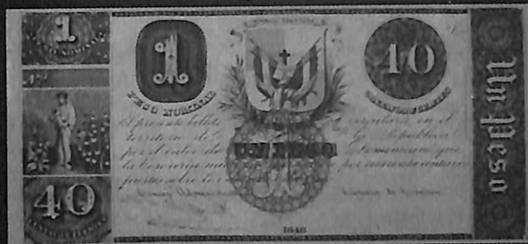
Primer billete impreso en el extranjero