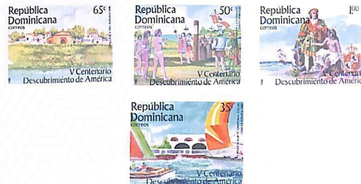
Serie V Centenario del Descubrimiento de América, IV Regata Almirante Cristóbal Colón - Casa de España

Fecha de emisión: 10 de octubre de 1984 • Diseño: Pedro Céspedes y Sistema Creativo • Impresor: Litografía Ferrúa & Hermanos • Cantidades: 200,000 ejemplares de RD$ 0.10 y RD$ 0.35 / 100,000 ejemplares de RD$ 0.65 y RD$ 1.00 • Perforación: 13½ • Tamaño: 40 x 30mm • Decreto: 2409 del 5 de octubre de 1984.