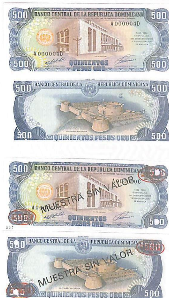
Billete de RD$500.00 • Emisión: 4ta. familia • Año: 1992 • Anverso: Viñeta del Teatro Nacional • Reverso: Viñeta de la Fortaleza San Felipe de Puerto Plata • Casa fabricante: Thomas De La Rue & Co. Limited.