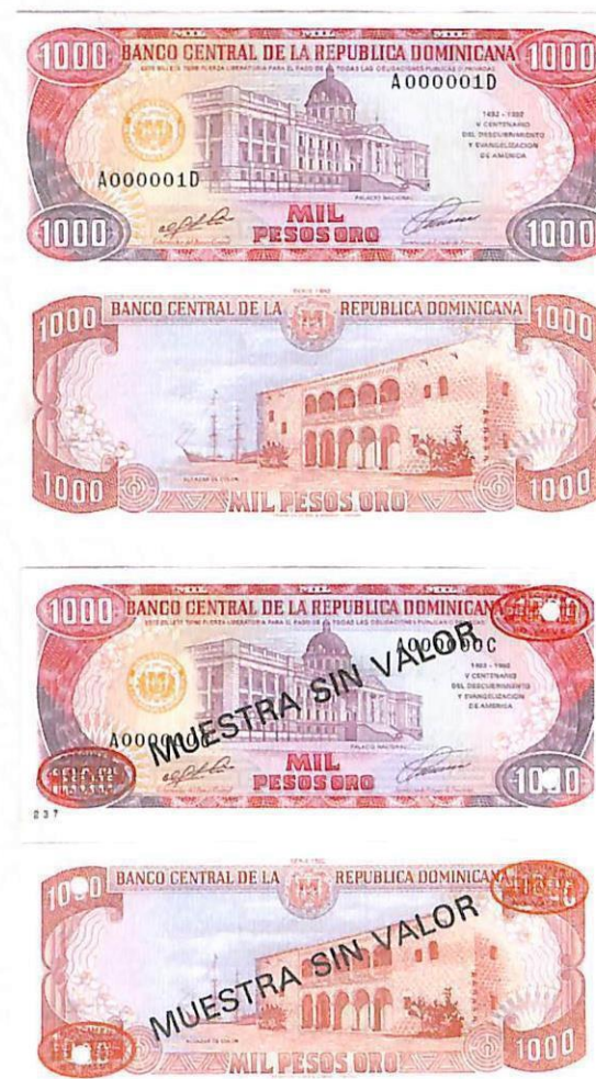
Billete de RD$1,000.00 • Emisión: 4ta. familia • Año: 1992 • Anverso: Viñeta del Palacio Nacional • Reverso: Viñeta del Alcázar de Colón • Casa fabricante: Thomas De La Rue & Co. Limited.