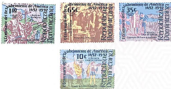
Serie V centenario del Descubrimiento de América, III Regata Casa de España

Fecha de emisión: 10 de octubre de 1984 • Diseño: Pedro Céspedes y Sistema Creativo • Impresor: Litografía Ferrúa & Hermanos • Cantidades: 200,000 ejemplares de RD$ 0.10 y RD$ 0.35 / 100,000 ejemplares de RD$ 0.65 y RD$ 1.00 • Perforación: 13½ • Tamaño: 40 x 30mm • Decreto: 2409 del 5 de octubre de 1984.